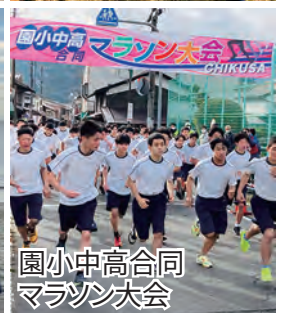
園小中高合同マラソン大会