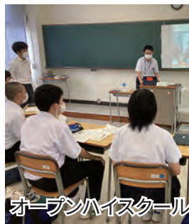
オープンハイスクール