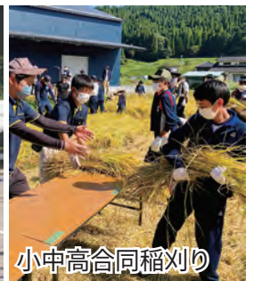
小中高合同稲刈り