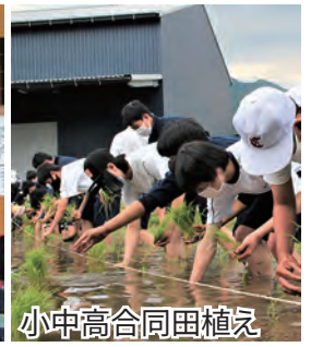
小中高合同田植え